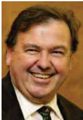
Donald Grant, Minister van Onderwys, Wes-Kaap

Dit is die visie van die Wes-Kaapse Regering om die lewenskans van leerders in die provinsie deur verbeterde onderwysuitkomst te bevorder.