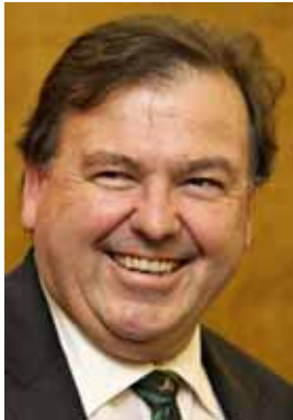
Donald Grant, Minister van Onderwys, Wes-Kaap

Die Wes-Kaap Regering sal die lewensuitsigte van al sy kinders verbeter deur die voorsiening van gehalte-onderwys. Met dié doel sal alle kinders vir so lank as moontlik op skool bly en optimale resultate behaal. Die fokus vir die tydperk 2010 tot 2019 sal veral op die verbetering van leerders se lees-, skryf- en berekeningsvermoë wees. Die tydperk 2010-2014 sal die fundamente vir hierdie verbeterings lê. Gedurende die tydperk 2014-2019 sal die provinsie se kinders die vrugte pluk van 'n stelsel wat ontwerp en bestuur is om gestelde doelwitte te bereik.