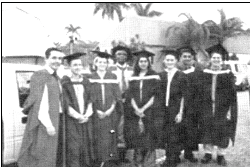
[Zwi bva kha Internet]