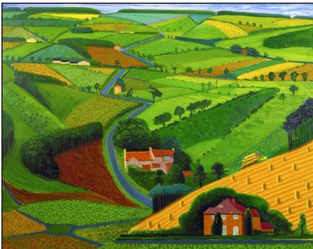
FIGUUR 5: David Hockney, 'n Groter Prentjie, iPad-digitale kunswerk, 2020. Hockney het verskeie iPad-tekeninge en plein air van die oostelike Yorkshire-landskappe gemaak wat die oorgang van winter na somer wys.