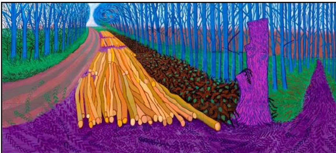
FIGUUR 4: David Hockney, iPad-digitale kunswerk, 2020.