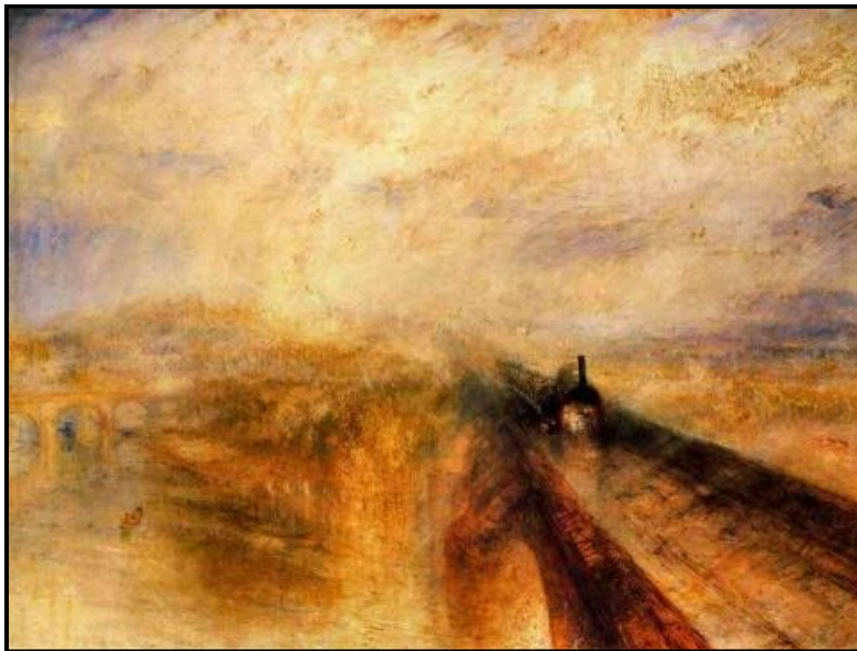
FIGUUR 2: William Turner, Reën, Stoom en Spoed – Die Groot Westerse Spoorlyn (' Rain, Steam and Speed – The Great Western Railway '), olie op doek, 1844.

Kunstenaars word oor die eeue heen deur die uitbeelding van die natuur en landskappe gefassineer.