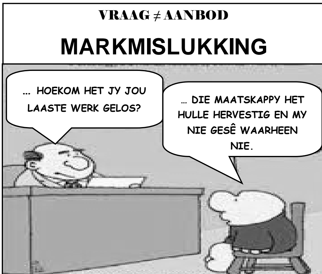
[Aangepas uit Internet Cartoons]

2.3 Bestudeer die spotprent hieronder en beantwoord die vrae wat volg.